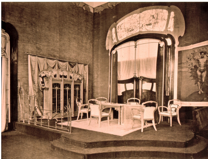
Eetkamerensemble – Victor Horta