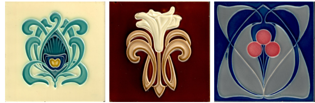
Tegels uit de collectie Pozzo

Wolfers wist perfect gebruik te maken van de eigenheid van de materialen. Hij was de enige die volledige slagstanden of stukken ervan gebruikte in een vorm die hun oorsprong duidelijk verraadde.