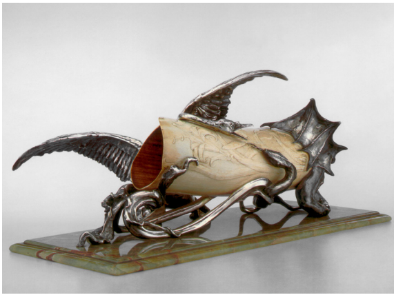
Beschaving en Barbarij – Philippe Wolfers