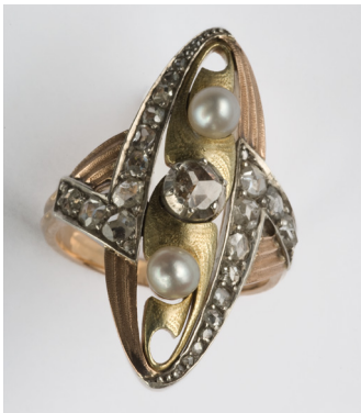
Ring – Henry van de Velde