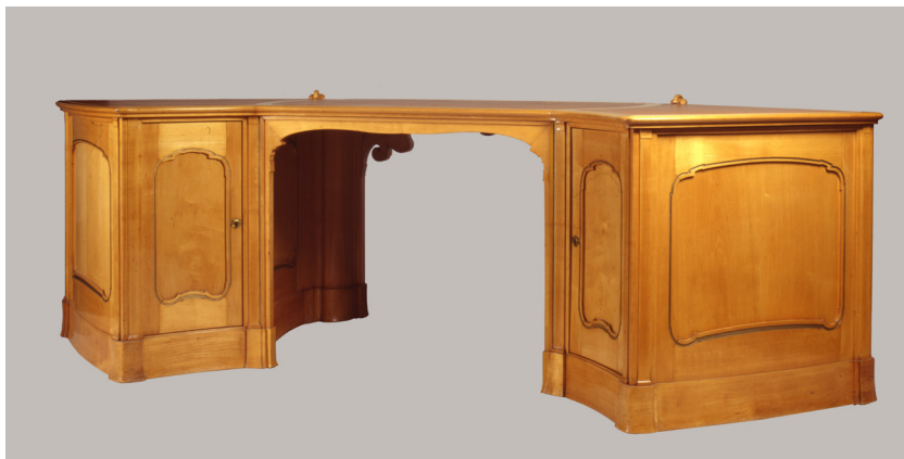
Bureau – Victor Horta

Deze meubelen ontwierp Victor Horta voor de Eerste Internationale tentoonstelling voor Decoratieve Kunsten die in 1902 in Turijn door ging. Ze worden beschouwd als het hoogtepunt van Horta's meubelkunst in art-nouveaustijl. De complementariteit van de kleurenpracht van beide interieurs speelde een belangrijke rol. De internationale pers was vol lof over de door Horta ontworpen interieurs en hij werd dan ook bekroond met het erediploma, de grootste onderscheiding die werd uitgereikt door de internationale jury.