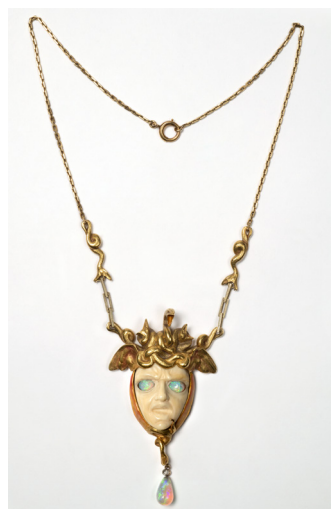
Hanger 'Medusa' - Philippe Wolfers

Het halssnoer 'Medusa', ontworpen in 1898, wordt internationaal aanzien als een icoon van de art-nouveajuweelkunst. Ze behoort tot de 'exemplaires uniques' van Wolfers: unieke, artistieke en hoogstaande creaties die hij nauwlettend inschreef in een register. 'Medusa' wordt niet alleen beschouwd als het belangrijkste symbolistische juweel dat Philippe Wolfers ontwierp, het is ook zijn meest opmerkelijke stuk. Het gelaat van 'Medusa' sneed hij in ivoor.