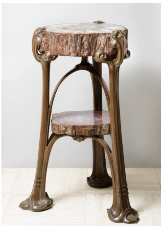
Piëdestal – Victor Horta