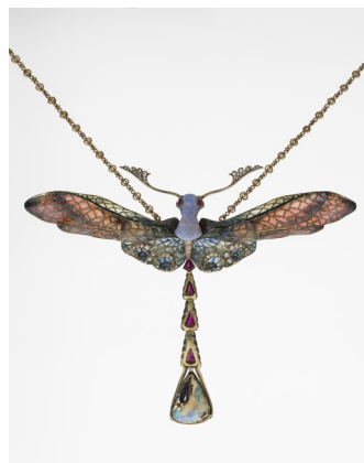
Halssnoer 'Libellule' - Philippe Wolfers

Een absoluut topwerk van Philippe Wolfers, in email, goud, diamant, opaal en Mexicaanse opaal. Ook een 'exemplaire unique' van Wolfers.