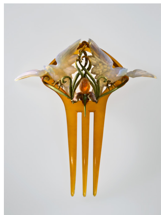
Sierkam 'Oiseaux et Iris' - Philippe Wolfers

Wolfers maakte in totaal 9 sierkammen. Vogels en Iris is de enige bekende sierkam die nog volledig is. Het draagt het merkteken van de Exemplaires Uniques en wordt bewaard in zijn originele schrijn, wat van dit juweel een bijzonder museumstuk maakt. Rond 1900 waren sierkammen reeds zeldzaam en bijzonder exclusief. Vandaag zijn sierkammen en haarornamenten in het algemeen een zo goed als verdwenen genre bij juweliers. Ook de Belgische musea bezitten quasi geen dergelijke juwelen.