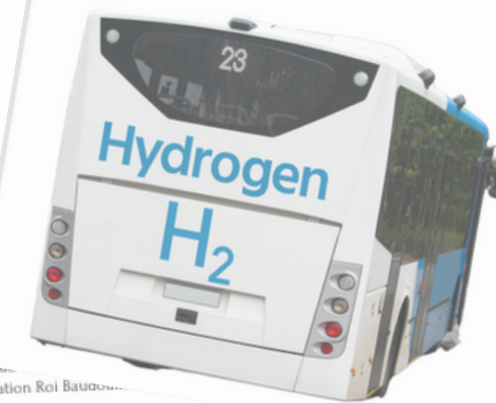
Controverses climatiques... ? Dialoguons ! Une activité pédagogique créée par EFDD asbl, à l'initiative de la Fondation Roi Baudouin.

Consciente des enjeux climatiques et de la responsabilité majeure des secteurs de la production énergétique et de la demande croissante en termes de consommation, l'Union européenne souhaite développer la recherche dans le domaine de l'hydrogène comme source d'énergie. Elle estime que l'hydrogène a un rôle crucial à jouer dans la transition écologique. Afin d'atteindre cet objectif, l'Union européenne propose, notamment : - Des récompenses pour encourager la demande et créer un marché européen de l'hydrogène et un déploiement rapide de l'infrastructure de l'hydrogène. - L'élimination progressive de l'hydrogène d'origine fossile dès que possible. Mais la recherche dans ce domaine reste encore peu avancée. Il devient donc urgent de dégager les fonds nécessaires pour passer de l'étape de la recherche à l'étape expérimentale, puis à l'étape de la production à grande échelle. Le budget qui a été prévu à cet effet s'élève à 300 millions d'euros. Le budget d'avenir pour atteindre une Europe climatiquement neutre. Il en va de même pour la communauté scientifique, divisée sur la question. La présidence de l'Union européenne décide donc de mettre sur pied une commission consultative qui aura pour but d'émettre un avis sur l'opportunité de débloquer 300 millions d'euros pour la recherche sur le développement de l'hydrogène comme source d'énergie d'avenir.