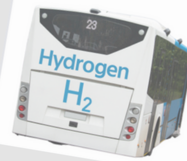
Controverses climatiques... ? Dialoguons ! Une activité pédagogique créée par EFDD asbl, à l'initiative de la Fondation Roi Baudouin.

Consciente des enjeux climatiques et de la responsabilité majeure des secteurs de la production énergétique et de la demande croissante en termes de consommation, l'Union européenne souhaite développer la recherche dans le domaine de l'hydrogène comme source d'énergie. Elle estime que l'hydrogène a un rôle crucial à jouer dans la transition écologique. Afin d'atteindre cet objectif, l'Union européenne propose, notamment : - Des récompenses pour encourager la demande et créer un marché européen de l'hydrogène et un déploiement rapide de l'infrastructure de l'hydrogène. - L'élimination progressive de l'hydrogène d'origine fossile des que possible. Mais la recherche dans ce domaine reste encore peu avancée. Il devient donc urgent de dégager les fonds nécessaires pour passer de l'étape de la recherche à l'étape expérimentale, puis à l'étape de la production à grande échelle. Le budget qui a été prévu à cet effet s'élève à 300 millions d'euros. Néanmoins, certains pays ne visent pas dans l'hydrogène une réelle solution d'avenir pour atteindre une Europe climatiquement neutre. Il en va de même pour la communauté scientifique, divisée sur la question. La présidence de l'Union européenne décide donc de mettre sur pied une commission consultative qui aura pour but d'émettre un avis sur l'opportunité de débloquer 300 millions d'euros pour la recherche sur le développement de l'hydrogène comme source d'énergie d'avenir.