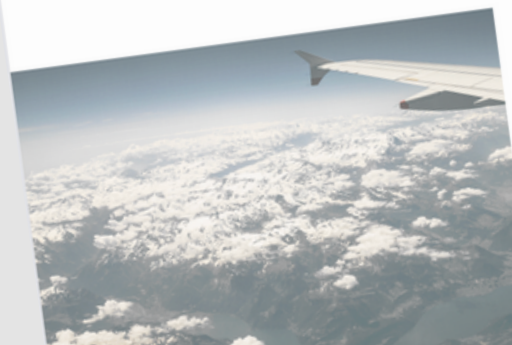
Controverses climatiques... ? Dialoguons ! Une activité pédagogique créée par EFDD asbl, à l'initiative de la Fondation Roi Baudouin.

Une pétition s'opposant à ce projet, principalement pour des raisons écologiques (nuisances sonores, augmentation de la pollution, augmentation du trafic routier, expropriations de plusieurs petits paysans, etc.), a recueilli plus de 150 000 signatures. Par suite de cette pétition, le gouvernement de la région Grand Centre a convoqué une commission citoyenne consultative, composée d'acteurs impliqués directement et indirectement par ce projet. Il lui est demandé de remettre un avis quant à l'opportunité du projet.