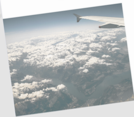
Controverses climatiques... ? Dialoguons ! Une activité pédagogique créée par EFDD asbl, à l'initiative de la Fondation Roi Baudouin.

Une pétition s'opposant à ce projet, principalement pour des nuisances sonores, augmentation de la pollution, augmentation des expropriations de plusieurs petits paysans, etc., a recueilli 10 000 signatures. Par suite de cette pétition, le gouvernement de la région Grand Centre a convoqué une commission citoyenne consultative d'acteurs impliqués directement et indirectement par le projet. Elle a demandé de remettre un avis quant à l'opportunité du projet.